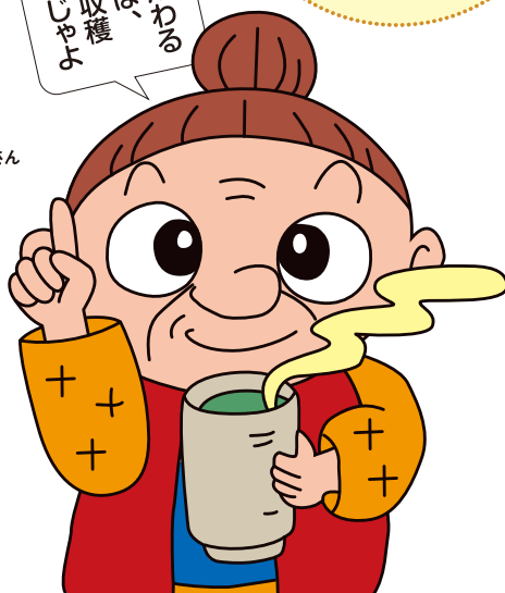
伊勢茶イメージキャラクター 茶柱タツ